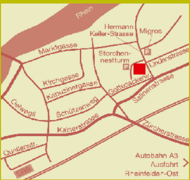
Offener Trauertreff Rheinfelden